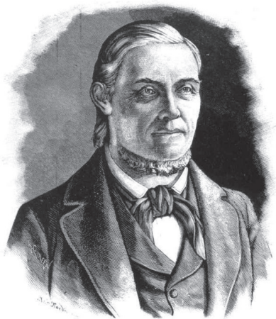
Hans Nielsen Hauge.

verta viste på ei vandreutstilling og strikke-opskriftene vil bli publiserte. Etter ei tid vil alle sokkane verta gjevne til eit godt føremål. Vinnaren får ein pengepremie i tillegg til heider og ære.