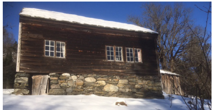
Slik ser huset i Notten ut i dag.

Kong Olav V, som vart det 20-århundres norske namn etter folkerøysting, sa ein gong at den timen i kyrkja var fin til «kontemplasjon» (ettertanke)! (Eg hadde røysta på han, og vonar eg får lov til å førehandsrøysta på Harald V når det gjeld det 21-hundreåret!)