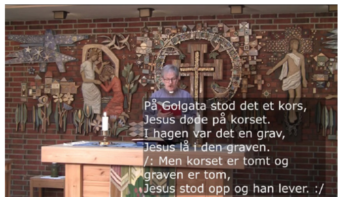
Johannes og Eidfjord støynde påskegudstenesta.