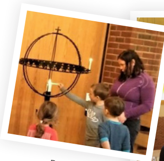
Barnehagen på besøk i kyrkja.

Me hadde ei koseleg samling. Samlinga vart bygd opp som minikyrkje, så det var kjent for borna kva som skulle skje. Borna kom til kyrkja og fekk leika på forskjellige stasjonar. Dei kunne velja mellom lego, treklossar, dokker, fargelegging og meir. Etter ei stund samla me oss i barnekroken. Der song me i lag, og eg fortalde påskeeveliet. Sjølv sagt måtte me avslutta med såpebobler. Det var ei koseleg stund med mange glade born og vaksne. Me gler oss allereie til julesamlingane.