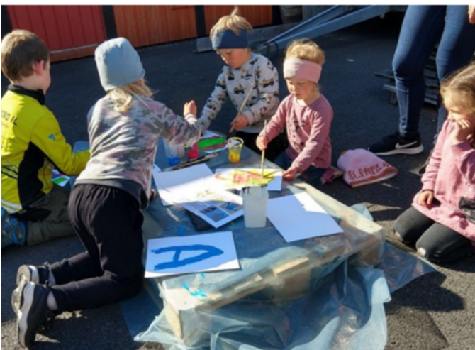
Born frå Eidfjord i full konsentrasjon.

aktivitetar ute. For å nemna nokon: kasta ball, huska, måla osv. Etter ei stund var det samlings-stund med song og dans og forteljinga om «Når Gud skapte verda».